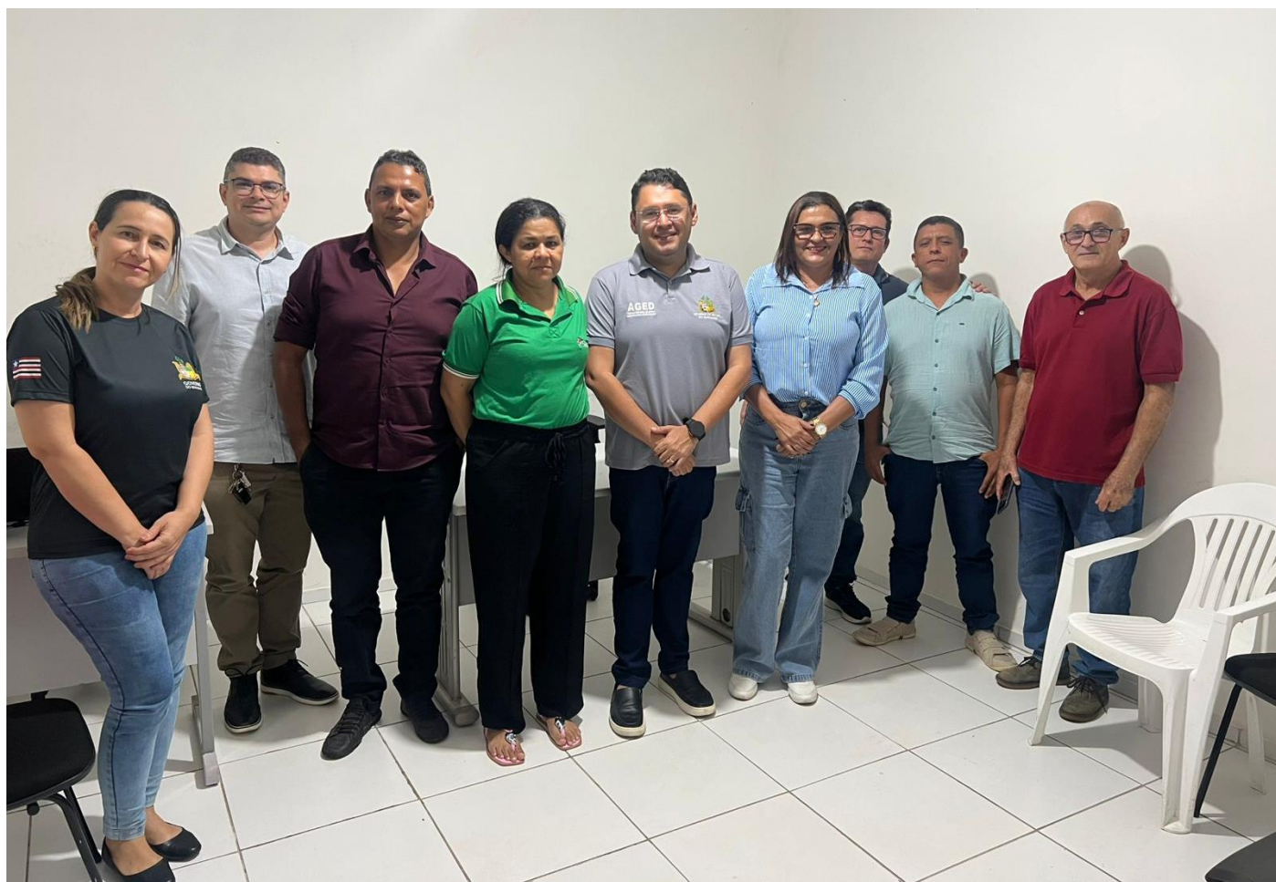
Reunião com filiados da Regional de Bacabal

O objetivo da ação é fortalecer a presença do sindicato na base, apresentando de forma transparente o andamento das demandas no primeiro ano da atual gestão e esclarecendo dúvidas sobre direitos e benefícios.