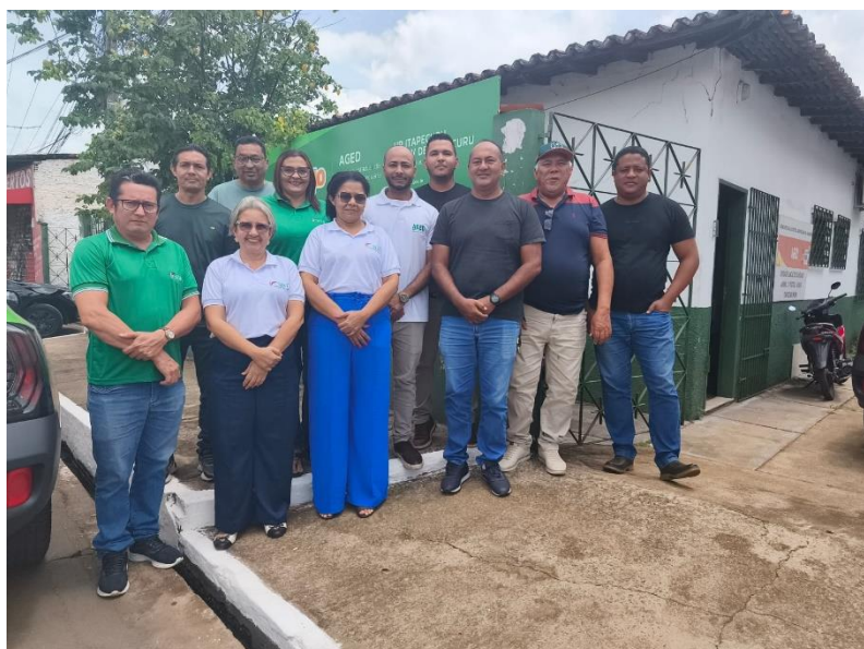
Reunião com filiados da Regional de Itapecuru Mirim

A Diretoria Executiva (DIREX) do SINFA-MA deu início, entre os dias 2 e 6 de fevereiro, à primeira etapa da agenda de Itinerância pelas Delegacias Regionais . O roteiro inicial percorreu as cidades de São Luís, Itapecuru-Mirim, Bacabal e Pedreiras , promovendo um diálogo direto entre a cúpula sindical, delegados e servidores lotados no interior do estado.