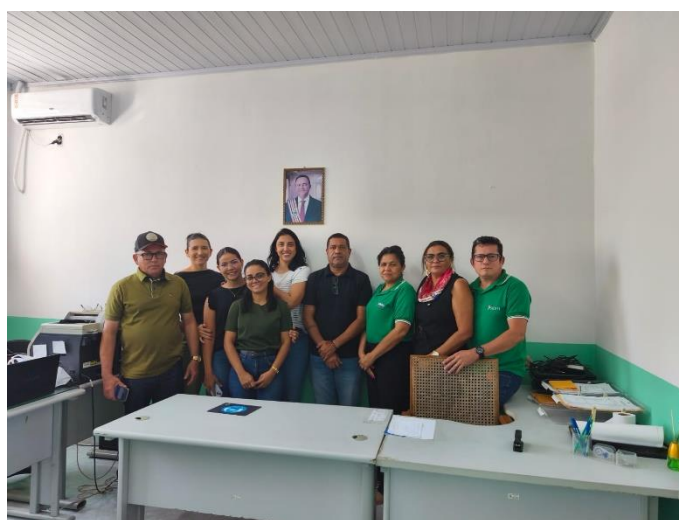
Reunião com filiados da Regional de Pedreiras