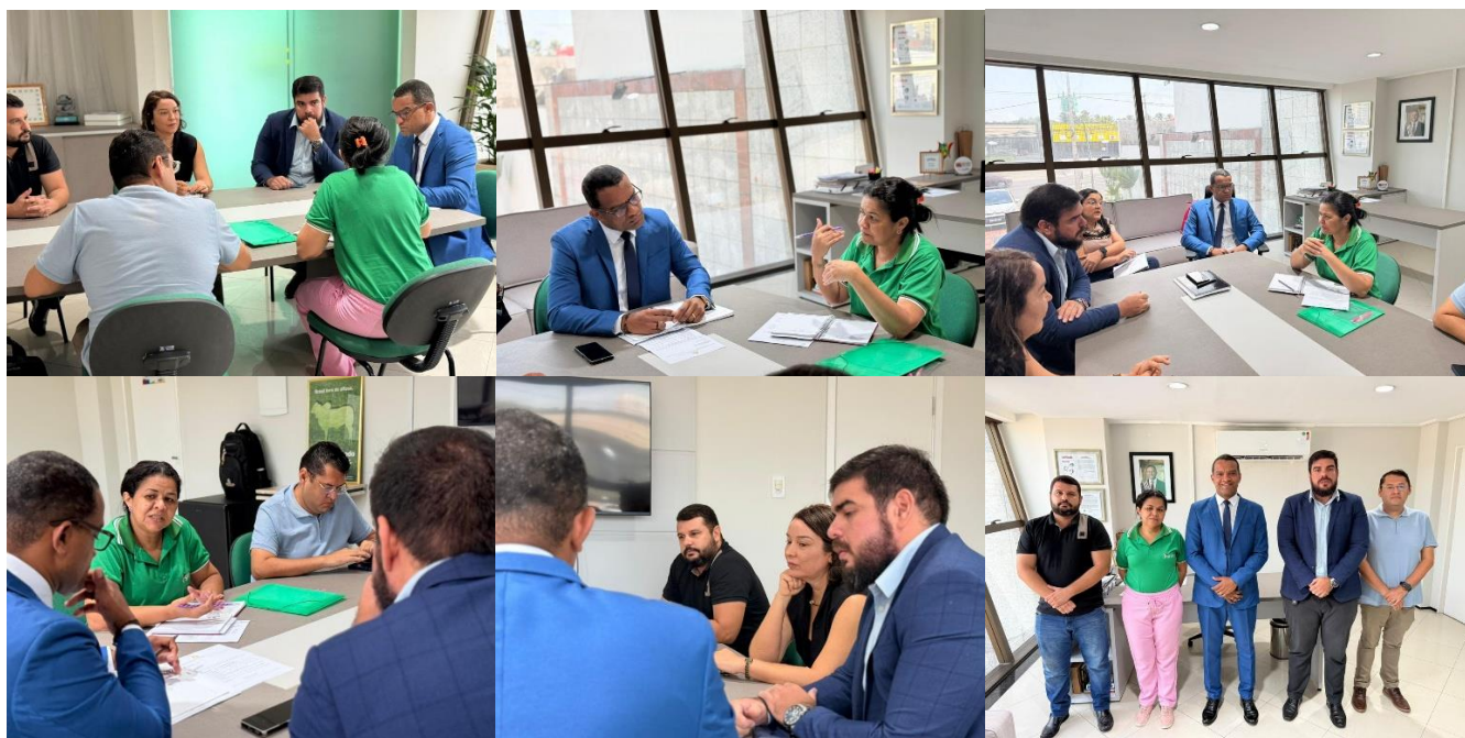
Reuniões com o Presidente da AGED e integrantes do SINFA-MA (acima) e com o Secretário de Administração do Estado (abaixo). Todas ocorridas ainda em janeiro de 2026.