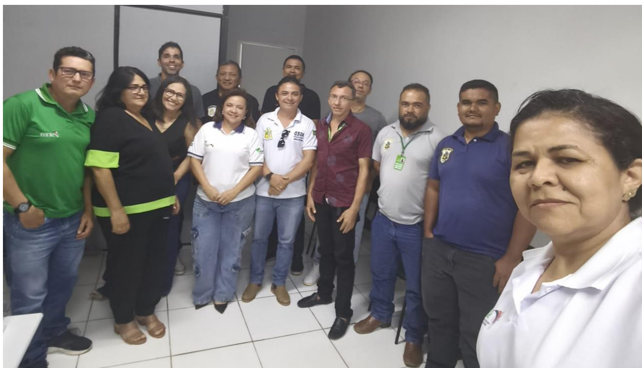
Reunião com filiados da Regional de Presidente Dutra

SINDICATO DOS SERVIDORES DA FISCALIZAÇÃO AGROPECUÁRIA DO MARANHÃO - SINFA-MA 01 a 15 de fevereiro de 2026. - Pág 4